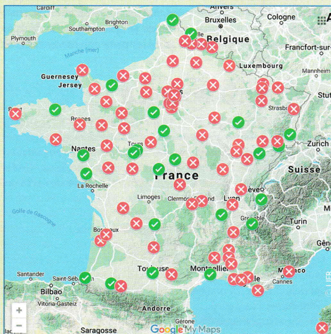
La carte vous indique les syndicats qui ont répondu.

Déjà, plus d'un quart des syndicats ont répondu, l'objectif étant de présenter une cartographie complète de l'implantation des SSR, ainsi que de leur fonctionnement lors du congrès de la FGMM au mois de juin 2021. Les premiers retours nous donnent déjà quelques pistes pour aider les syndicats lors du transfert d'un adhérent et leur proposer la mise en place d'une convention de fonctionnement des SSR dans les UTR. Ce travail permettra aussi d'enrichir le site rénové de l'UFR, en intégrant une carte interactive pour permettre aux futurs retraités de contacter les correspondants des SSR Métaux.